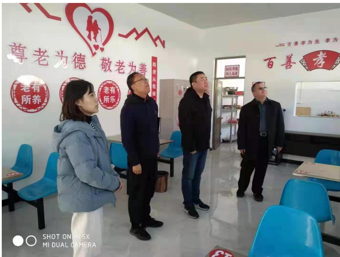
现场查看杏坛新村幸福食堂硬件设施