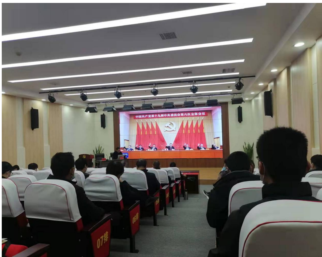
专题辅导会议现场

换届刚刚完成不久，党支部的标准化和规范化建设恰好是我们的“刚需”，本次报告真是给我们送来了一场“及时雨”。