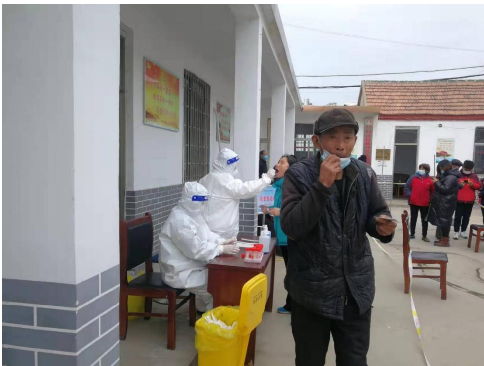
岳村队员和村民全员核酸进行中

3月23日，杏坛新村工作组使用工作经费3000余元购买了医用酒精、防护口罩、84消毒液和医用抑菌洗手液等物资，送到了村委大院和居民手中，助力仓门村村民科学防疫。