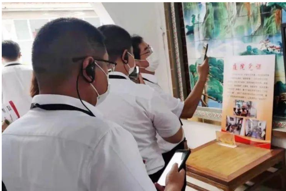
姚村镇孔家村观摩现场

此外，孔家村共 380 户，1416 人，党员 55 名，支部成员 5 人。近年来，抢抓乡村振兴战略机遇，以“儒乡福地、荷美孔村”为品牌打造传统文化“两创”融入基层党建示范村；探索村集体与群众共同致富道路，盘活 30 亩旱藕池，发展荷下经济，立体养殖龙虾，年底可为村集体增收 15 万元；发包 80 余亩荒滩种植桃树，每亩每年增收 800 元。第一书记服务队驻村帮扶期间，制定长远发展规划，落实、落细党员划片定岗联户职责，制定联户网格，细化分工、压实责任；深挖村内闲置资源，以村庄建设为突破口，投资 180 余万元对全村进行升级改造；总结出“四个一”乡村善治工作法，即公生明、廉生威、民为先、法为上，将责任握在手中，担当放在心头，努力打造“儒乡福地、荷美孔村”善治品牌。