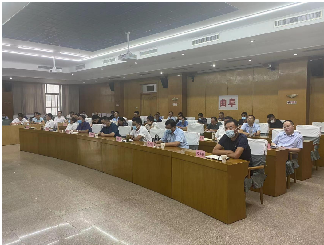
曲阜市视频分会场

8月25日，为帮助全市下派干部深入分析认识农村党建工作面临的新形势，提升第一书记和工作队队员抓党建促乡村振兴能力水平，推动农村基层党建和驻村帮扶工作融合发展、提质增效，市下派办组织召开了全市第一书记和工作队专题培训会议，本次培训会议特别邀请了省委组织部组织三处二级调研员张健作专题培训。培训会采用视频会议形式进行，曲阜市原“加强农村基层党组织建设”工作队全体成员，各济宁市派第一书记，各第一书记服务队队长、联络员；帮扶镇街党（工）委组织委员，市委组织部门相关科室负责同志，在曲阜市委第四会议室参加了本次培训会议。