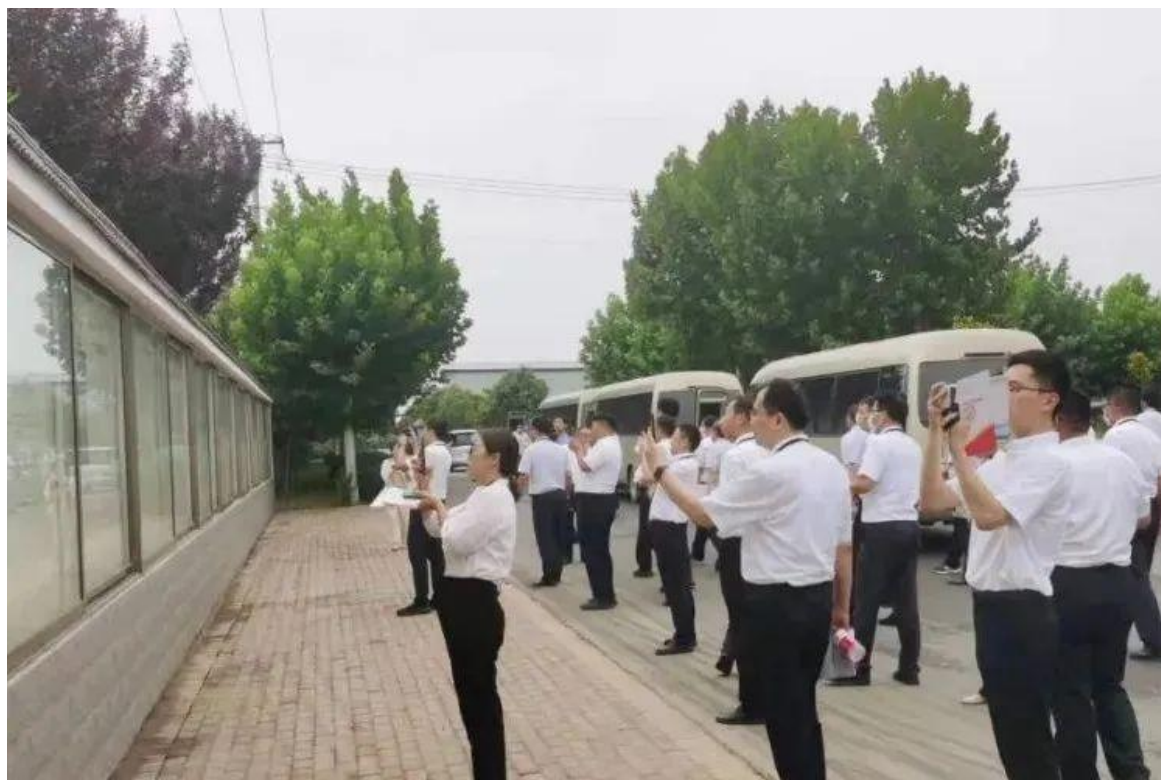
书院街道村观摩现场

诗礼、五心砺大德”基层社会治理品牌；引进突尼斯软籽石榴特色种植项目，年均增收约 10 万元；投资 350 余万元建设占地 2500 余平方米、库存 500 吨的机械制冷库，年均增收约 15 万元，打开了村集体和群众共同富裕的大门。第一书记驻村帮扶期间，制定了中长远发展规划，完善了村规民约及相关规章制度；厚植为民情怀，解决村民所需所求，在疫情防控中当先锋做表率；为村集体产业项目发展献言献策，提供人才、技术等方面帮扶支持；推动北京大学光华管理学院“耘耕计划”乡村振兴专题调研基地落户官家村，借助高校顶端智力支持及资源优势，联合打造乡村振兴示范样板，助推申报“美丽乡村”以及乡村振兴“十百千”示范村项目。